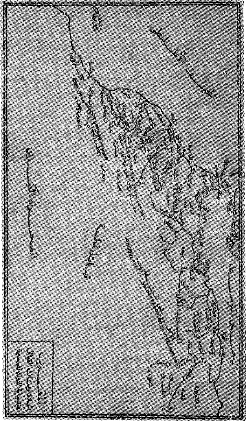
الغرب البلاد ومنازل القبائل عند بداية الدولة الوحدانية